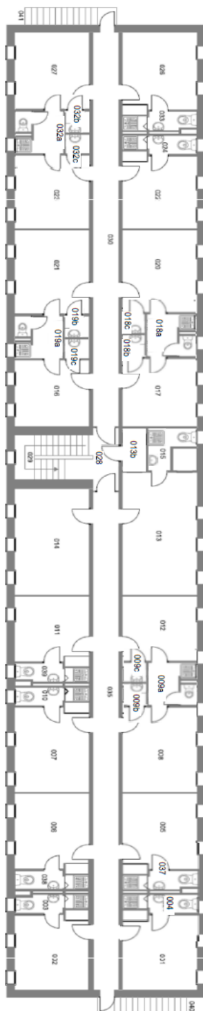
Bât. 049 R+1 - Aile Sud